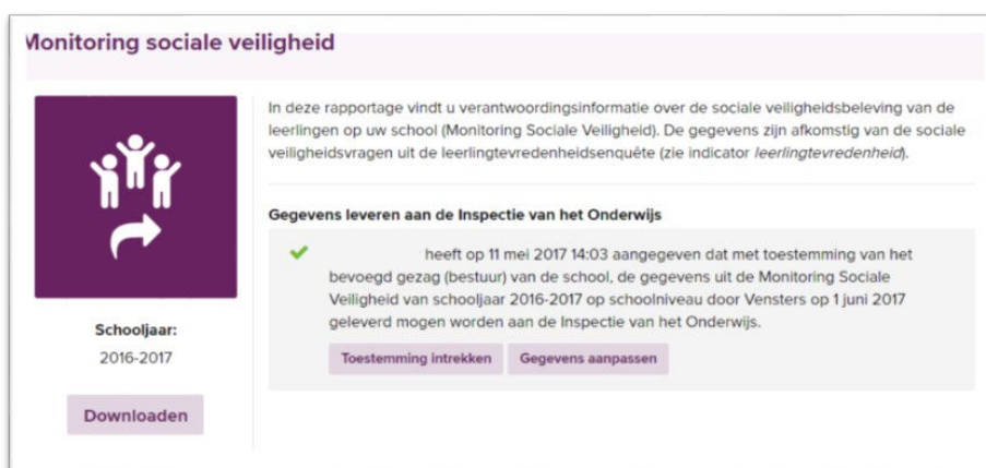
Afbeelding 4: Afronding

Wanneer u uw gegevens opslaat, wordt er een e-mail gestuurd aan de gebruikersbeheerder van Vensters op bestuursniveau. In deze e-mail wordt aangegeven wie toestemming heeft gegeven, op welke niveau de gegevens worden geleverd en welke datum geselecteerd is. Verleende toestemming kan tot één dag voor de gekozen datum nog gewijzigd of ingetrokken worden.